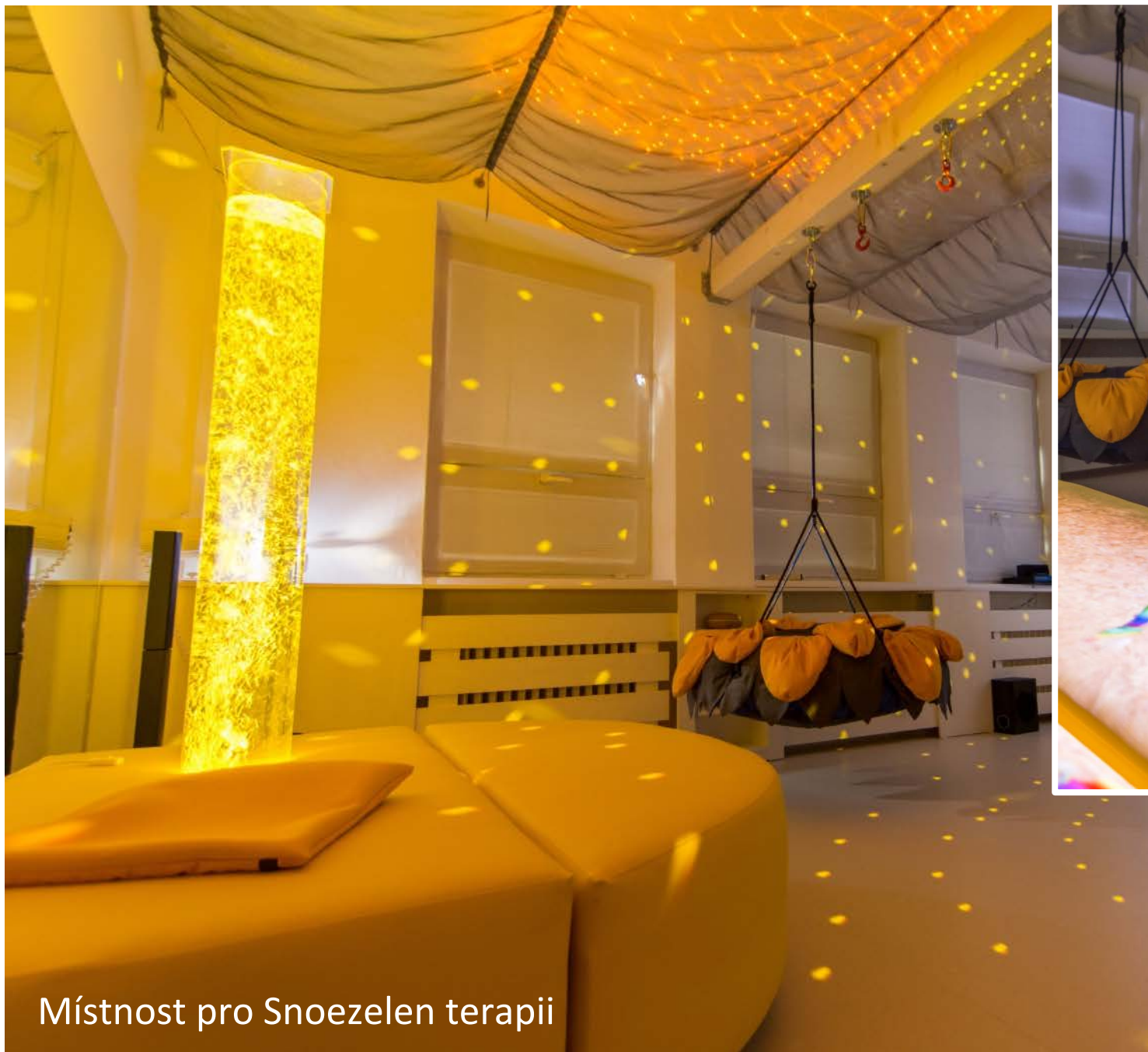
Místnost pro Snoezelen terapii