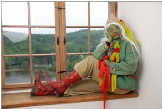
Vítězný snímek soutěže Nejkrásnější fotografie z území MAS - 1. místo v kategorii „Lidé“ Absolutní vítěz soutěže, MAS Prostějov venkov o.p.s.