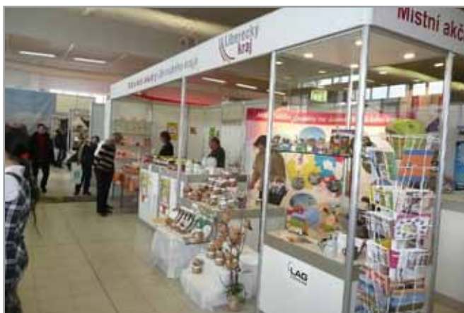
Vítězný snímek soutěže Nejkrásnější fotografie z území MAS - 1. místo v kategorii „MAS“ LAG Podralsko

Neformální vzájemná spolupráce se osvědčila a neuvažuje se o zřízení formální krajské organizace.