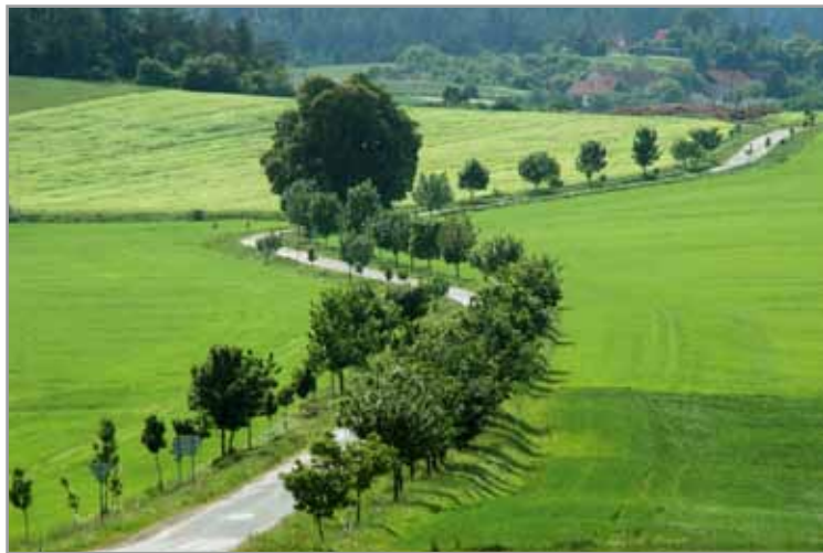
Vítězný snímek soutěže Nejkrásnější fotografie z území MAS - 1. místo v kategorii „Příroda“ MAS Prostějov venkov o.p.s.

Ke splnění některých úkolů nebo k zajištění dlouhodobé specializované činnosti Výboru může Výbor zřídit pracovní skupiny (dále jen „PS“) složené z členů Výboru, členů NS MAS ČR, případně externích odborníků. Činnosti pracovních skupin jsou zaměřeny na plnění cílů a hlavních úkolů NS MAS ČR.